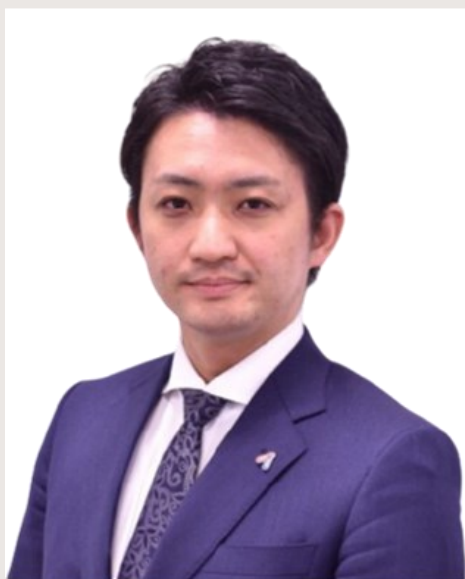
株式会社あしたのチーム 東日本営業部 部長