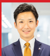
株式会社あしたのチーム