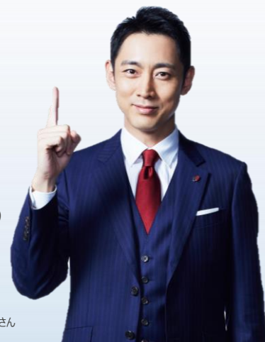
あしたのチーム アンバサダー 小泉 孝太郎さん