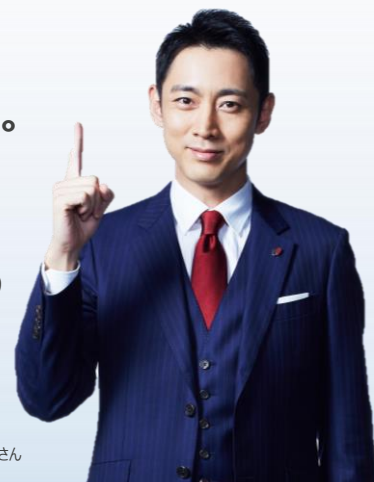
あしたのチーム アンバサダー 小泉 孝太郎さん