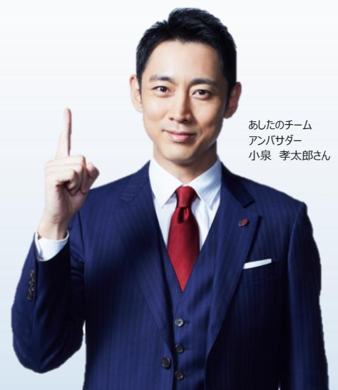
あしたのチーム アンバサダー 小泉 孝太郎さん

※インターネット環境が整っていれば、オフィスやご自宅等、お好きな場所で参加可能です。