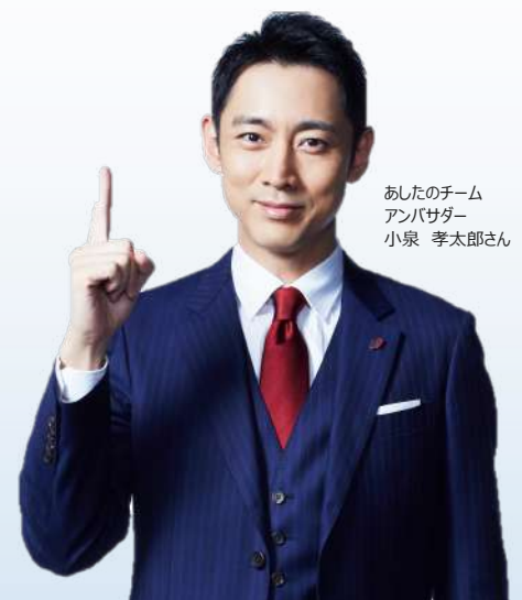
あしたのチーム アンパサダー 小泉 孝太郎さん

※インターネット環境が整っていれば、オフィスやご自宅等、お好きな場所で参加可能です。