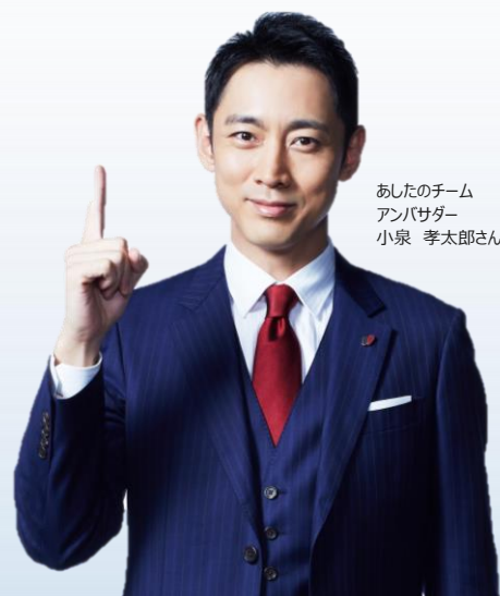
あしたのチーム アンバサダー 小泉 孝太郎さん

日程 : 8月26日 水曜日 時間 : 14:00～15:30 会場 : オンライン実施 URL : お申し込み後ご案内