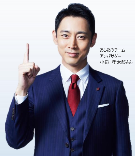
あしたのチーム アンバサダー 小泉 孝太郎さん

あしたのクラウドの機能をもっと便利にご利用いただくために、オンラインサロンを開催致します。