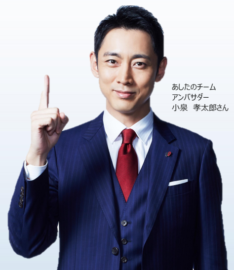
あしたのチーム アンバサダー 小泉 孝太郎さん

※インターネット環境が整っていれば、オフィスやご自宅等、お好きな場所で参加可能です。