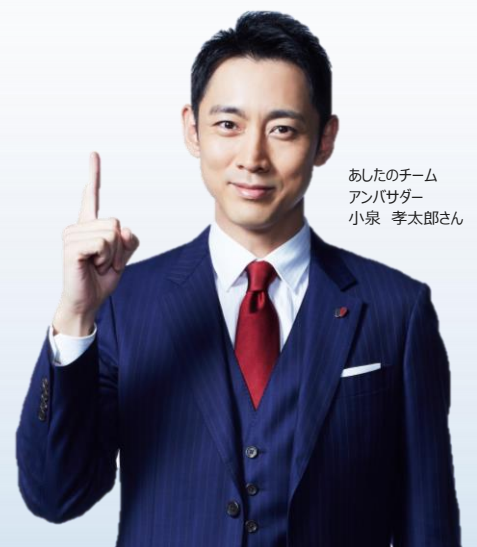
あしたのチーム アンバサダー 小泉 孝太郎さん

※インターネット環境が整っていれば、オフィスやご自宅等、お好きな場所で参加可能です。