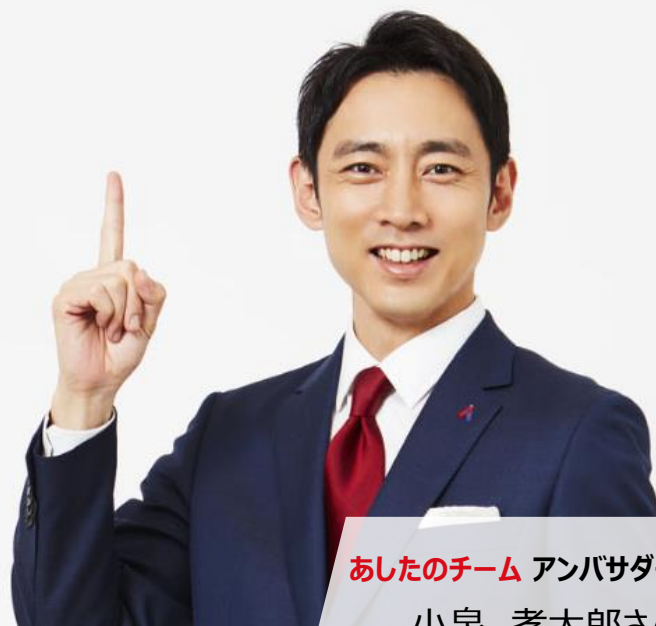
あしたのチーム アンバサダー 小泉 孝太郎さん

本講演では、これまでの人事評価制度についての常識を否定し、法人の業績アップと職員の給与アップを実現するための「あした式」人事評価制度のポイントを、ワークショップを交え徹底解説いたします！