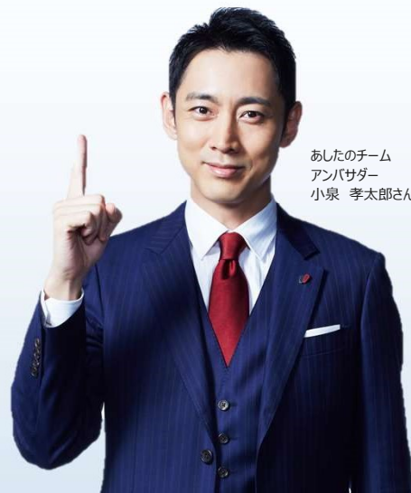
あしたのチーム アンバサダー 小泉 孝太郎さん