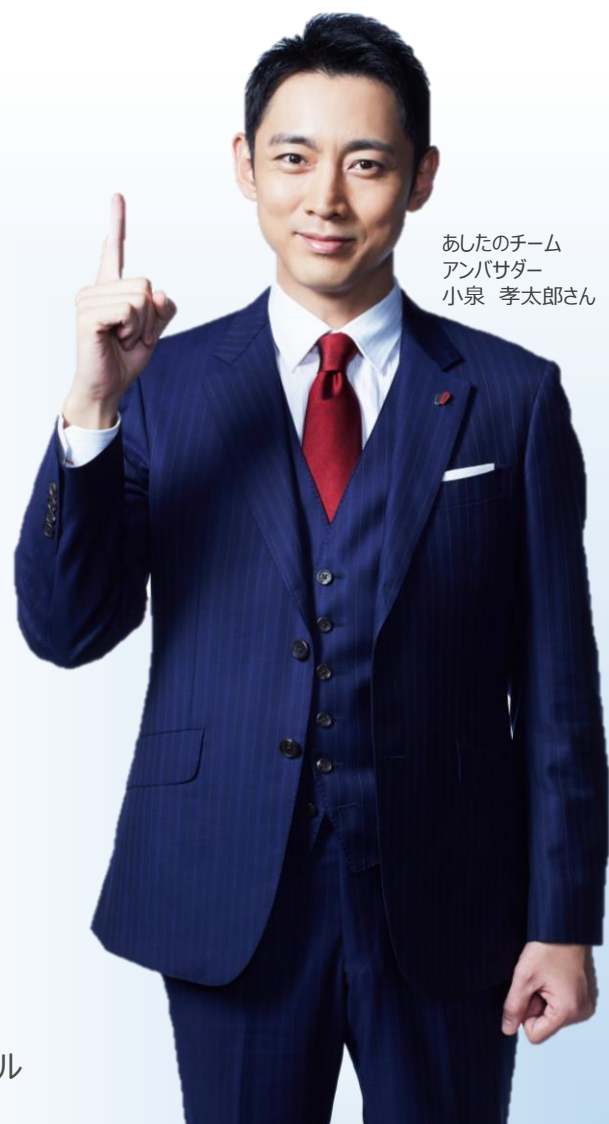
あしたのチーム アンバサダー 小泉 孝太郎さん

本講演では、人事評価制度についての常識を否定し、 会社の業績アップ と 社員の給与アップ を実現する1万人の経営者・人事担当者選ばれた人事評価制度を徹底解説いたします！