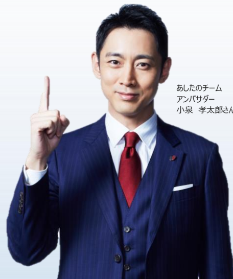
あしたのチーム アンバサダー 小泉 孝太郎さん