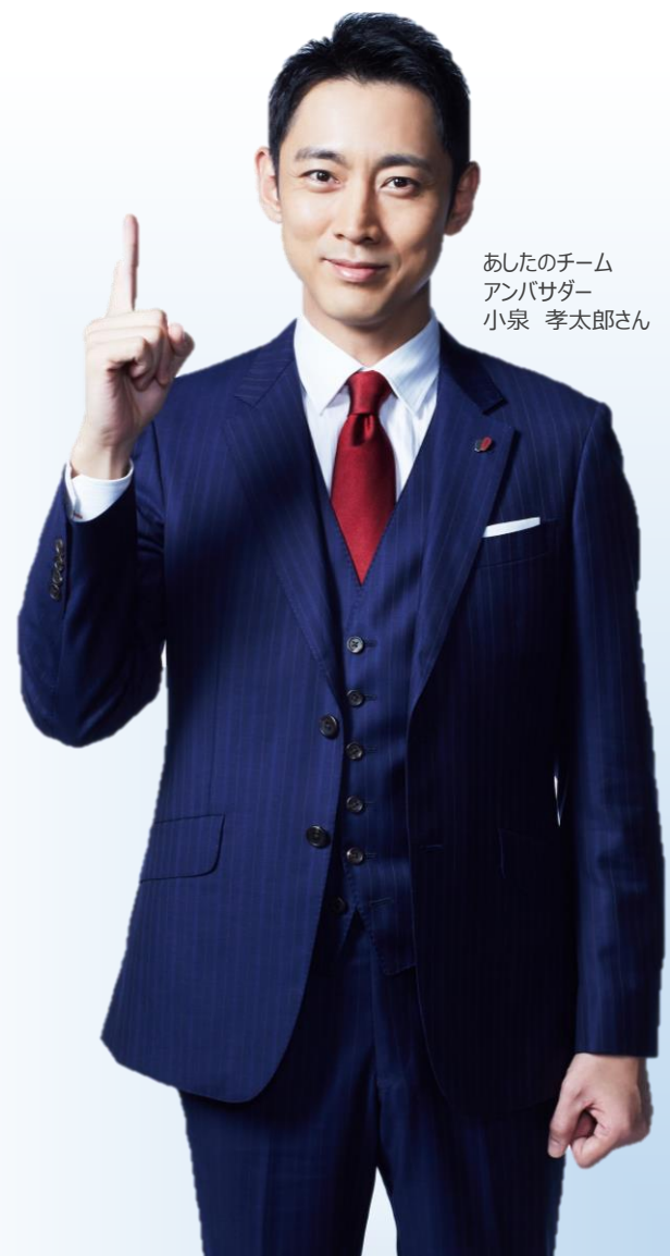
あしたのチーム アンバサダー 小泉 孝太郎さん