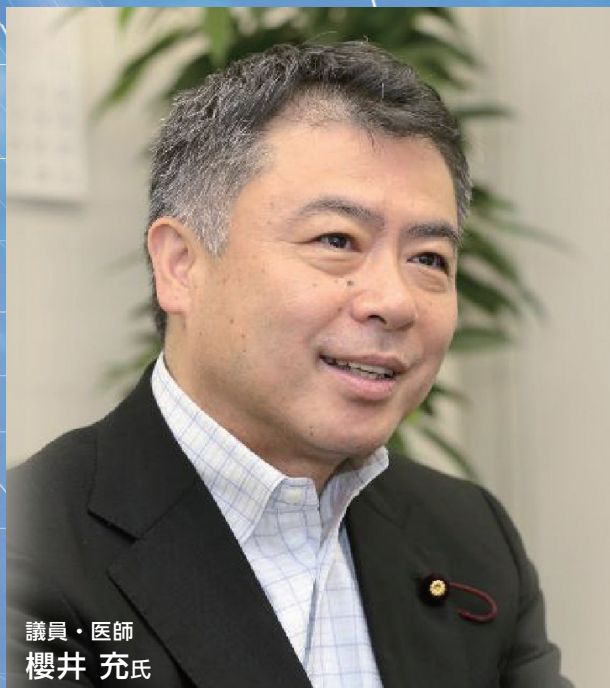
議員・医師 櫻井 充氏

1956年仙台市生まれ。仙台一高を経て、東京医科歯科大学医学部、東北大学医学部大学院卒。医学博士。元国立療養所若手病院第二内科医長。現在も医師として、アレルギー疾患や呼吸器疾患、拒食症、ひきこもり、不登校の子どもたちの心の治療に当たる。1998年初当選。財務副大臣、厚生労働副大臣、民主党政策調査会長を歴任。現在4期目。