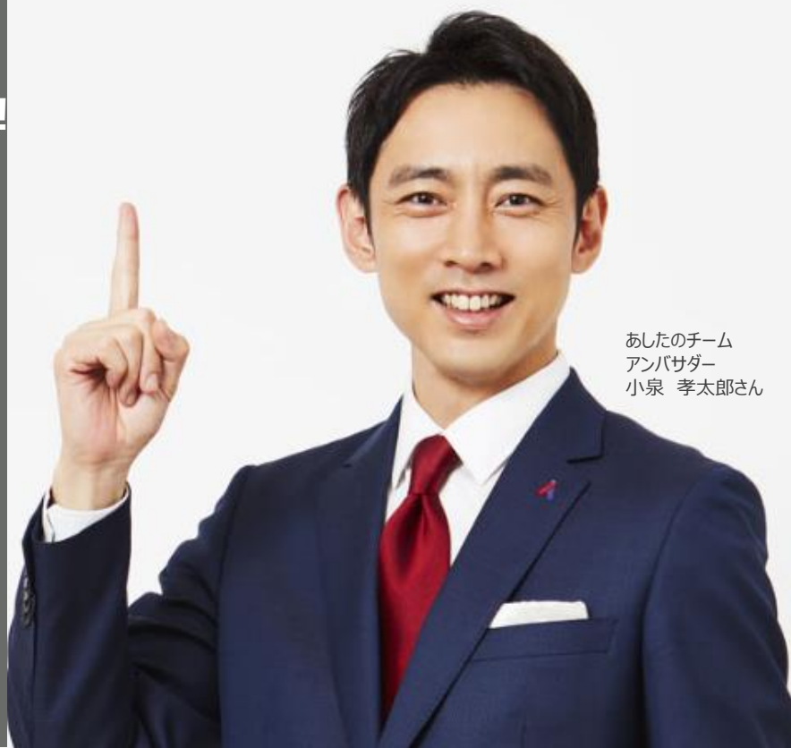
あしたのチーム アンバサダー 小泉 孝太郎さん