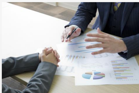
あしたのチーム アンバサダー 小泉 孝太郎さん

医療・介護・美容クリ ニク業向けで使われて いる評価項目の事例& 評価シートサンプルを プレゼント