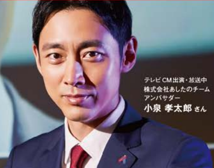
テレビCM出演・放送中 株式会社あしたのチーム アンバサダー 小泉 孝太郎 さん