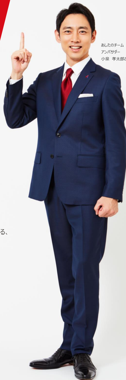
あしたのチーム アンバサダー 小泉 孝太郎さん

IT需要の拡大に対し、「慢性的なエンジニア不足」、 いかにして既存社員のやりがいを醸成し、離職率を下げ定着化させるか そして労使双方が納得できる賃金体系を構築するのか。 その鍵は私たちのご提供する、人事評価制度「ゼットイ！評価」にあります。 本セミナーでは、IT業界の専門的な知見があり、 かつ人事評価制度構築において豊富な実績、 経験を持つ弊社の「給与コンサルタント」が実際の導入事例と共に人財育成を同時に実現する、 「ゼットイ！評価」の仕組みと一緒に伝えたいです。