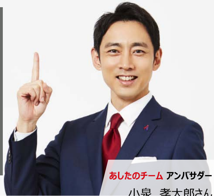
あしたのチーム アンバサダー 小泉 孝太郎さん