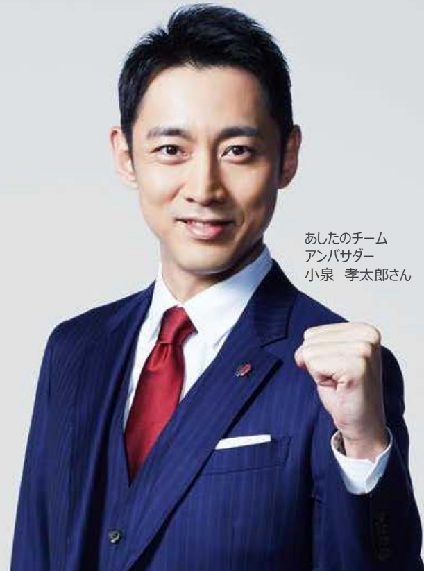
あしたのチーム アンバサダー 小泉 孝太郎さん