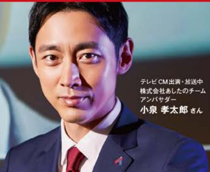
テレビCM出演・放送中株式会社あしたのチームアンバサダー 小泉 孝太郎 さん