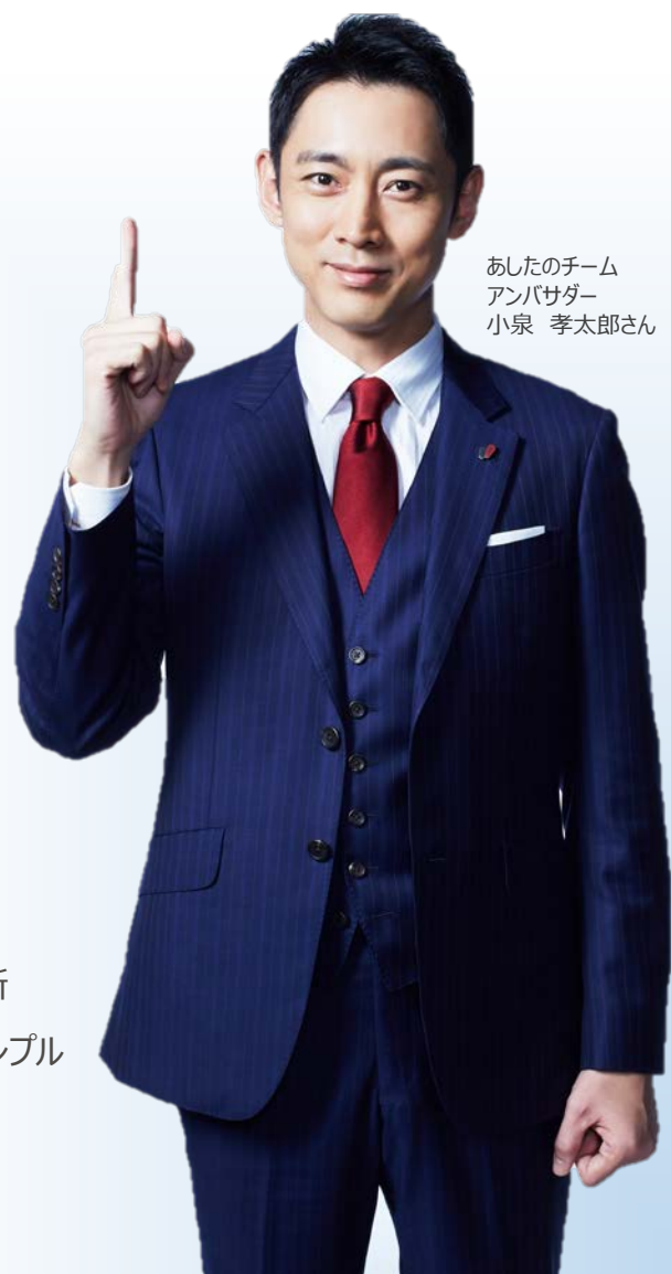
あしたのチーム アンバサダー 小泉 孝太郎さん

企業の方針を理解し、自律的に成長する社員の育成方法とは?? その極意をお伝えします。