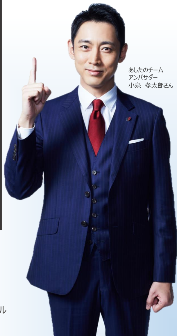
あしたのチーム アンバサダー 小泉 孝太郎さん