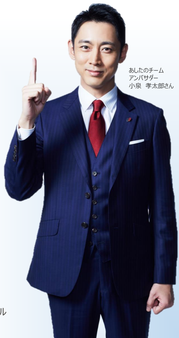
あしたのチーム アンバサダー 小泉 孝太郎さん

AI・SNSの浸透やニーズの多様化と 移り変わりにより、市場の 「急速な成長・陳腐化・衰退化」が 繰り返されています。 これらの変化に対応する為には、 権限委譲により意思決定を迅速 にする 必要があります。本セミナーでは 導入企業1,500社を超える 『ゼットイ!』評価®を通じて 行動目標の自己設定、達成に応じた 正当な評価と報酬を連動させる PDCAサイクルにより、権限委譲に 対応できる 自律型人財の育成 の方法を 完全解説します