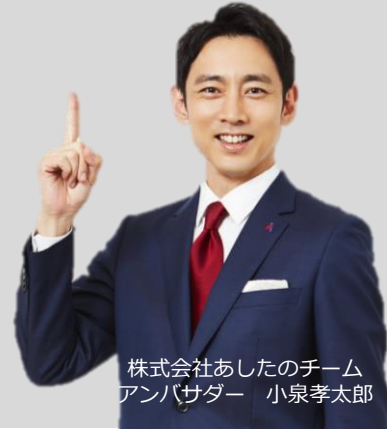
株式会社あしたのチーム アンバサダー 小泉孝太郎