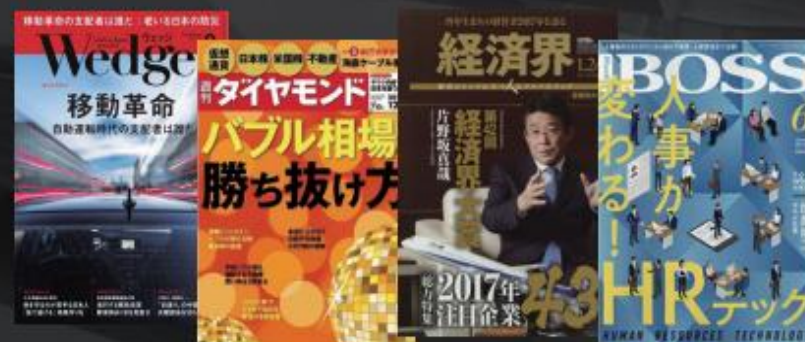
株式会社あしたのチーム掲載実績