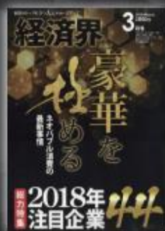
株式会社インファクト掲載実績