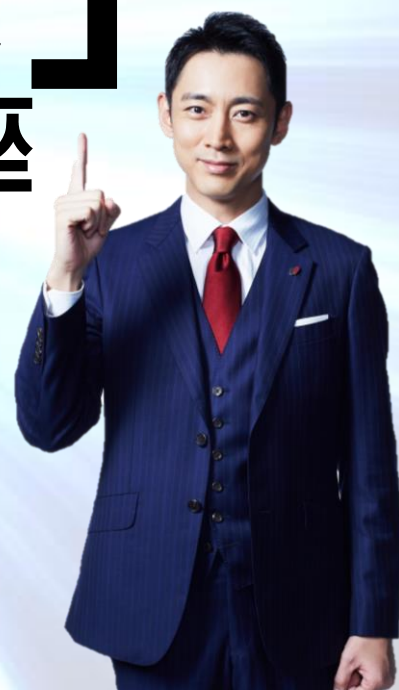
あしたのチームアンバサダー 小泉 孝太郎さん

「働き方改革」を実現する「あした式」人事評価制度の制度構築・運用のノウハウをすべてお伝え！！